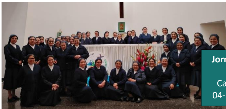
Jornada Regional Lima Casa Provincial 04-08 de octubre