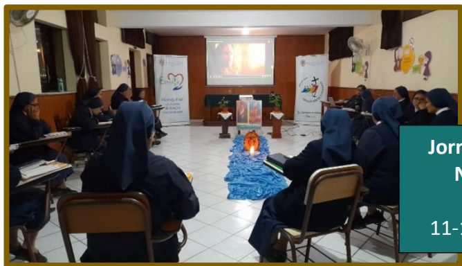
Jornada Regional Nor oriente Trujillo 11-15 de octubre