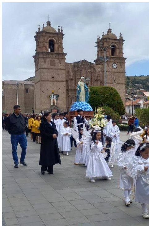
Comunidad Colegio la Inmaculada - Puno

Fue un tiempo de acción de gracias a Dios Padre, por seguir brindando el servicio educativo ininterrumpido; fortalecer los lazos e identidad como Familia Vicentina; y, por hacer presencia en medio de la Comunidad Puneña.